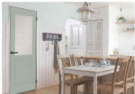
白い空間にキレイなブルーのドアがアクセントになった爽やかなインテリア。

木目や白をベースとしたシンプルなインテリアに、デザイン家具やカラフルなアクセントでポップな雰囲気に。