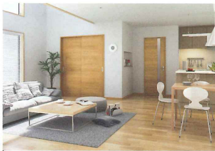
無駄のないデザインをベースに素朴な木の味わいをプラス。

温かみのある木目を活かし、色も白やベージュといったナチュラルカラー。グリーンも似合う心地よい空間。