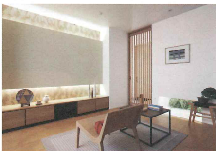
和の伝統を現代的にアレンジし、落ち着いた雰囲気の中にも洗練さを感じるスタイル。

落ち着いた濃色か白木のような明るい木目と、直線的な和のディテールや素材を使い、和の美しさを表現。