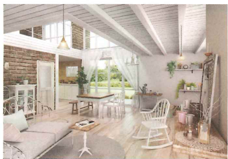
白を基調とした木の質感がお気に入りの雑貨を引き立たせる明るい空間。

シャビー・シックともいわれ、使い込まれたような味がある素材や明るい色のインテリアが特長の大人かわいいスタイル。