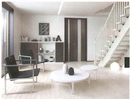
装飾を抑えたシンプルモダンな空間には、白・黒のコントラストがおすすめ。

シンプルながら高級感があり、洗練された都会的なスタイル。シンプルモダンや北欧モダンなどさまざま。