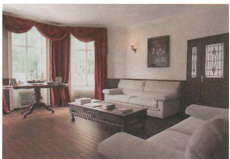
濃い色合いの床と框デザインの腰壁、ステンドガラスのドアで格調高いリビングに。

伝統的なヨーロッパ様式を取り入れたアンティークな雰囲気で統一。ダークなトーンで重厚感を演出。