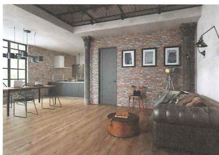
マットな質感の黒やブラウンカラーでまとめて個性的に仕上げます。

ヴィンテージ感に溢れたハードで男性的なスタイル。アイアンや古木などクラフト感のある素材が似合います。