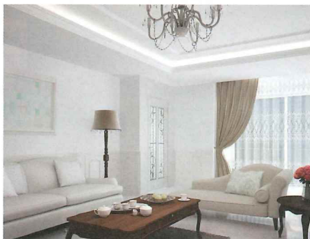
折り上げ天井に豪華なシャンデリア、床には大理石調のフロアを敷き詰めた華やかな空間。

優雅さと上品さを兼ね備えたヨーロッパスタイルのインテリア。女性的でラグジュアリーな雰囲気が魅力。